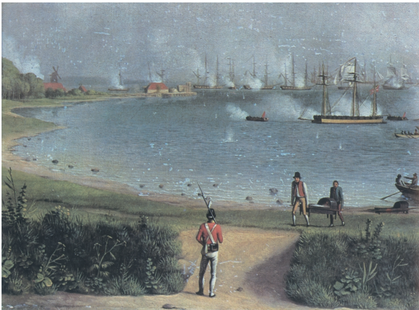
Søkampen under udfaldet i Classens Have, C.W.Eckersberg