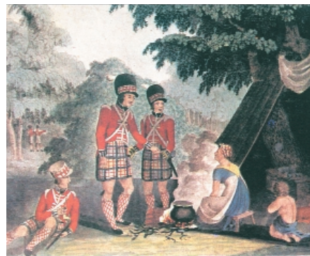
Skotter i Søndermarken

anseelige mængder materiel, og dobbeltmonarkiets handlefrihed var nu meget begrænset.